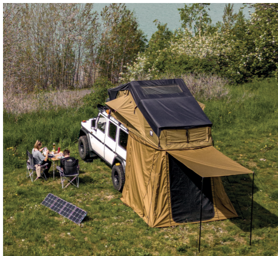
BIG WILLOW - DIE LEITER IST INNEN IM VORZELT

Das Vorzelt für das BIG WILLOW ist eine vielseitige Ergänzung zu Deinem Dachzelt. Es passt nahezu für jedes Fahrzeug, da es über das smarte Zipp-System in der Höhe eingestellt werden kann ( 165 - 180 cm oder 200 - 220 cm ). Mit einem Vorzelt hast Du die Option, Dein Dachzelt um zusätzlichen Lagerplatz, weitere Schlafplätze oder einen kleinen geschützten Aufenthaltsbereich zu erweitern. Durch die überlappenden Stoffbahnen, die wasserdichten Reißverschlüsse und die getapten Nähte ist das Vorzelt wasserabweisend und in geschlossenem Zustand blickdicht. Das Vorzelt lässt sich zu allen vier Seiten öffnen. Dadurch kommst Du jederzeit an Dein Fahrzeug und kannst seitliche Heckklappensysteme oder Küchenauszüge bei Wind und Wetter nutzen. Die Öffnungen sind mit flexiblen, engmaschigen Moskitonetzen versehen. Somit bist Du beim Lüften Deines Vorrums vor unangenehmen kleinen Fluggästen sicher. Über ein Teleskopstangen-System hast Du die Möglichkeit, Dir eine kleine überdachte Veranda zu schaffen, die Dir Schatten spendet oder einen Sitzplatz im Trockenen