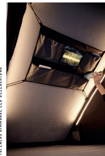
STUFENLOS DIMMBARE LED-BELEUCHTUNG