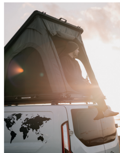
IN DEN FARBEN GRAU UND OLIVGRÜN ERHÄLTICH