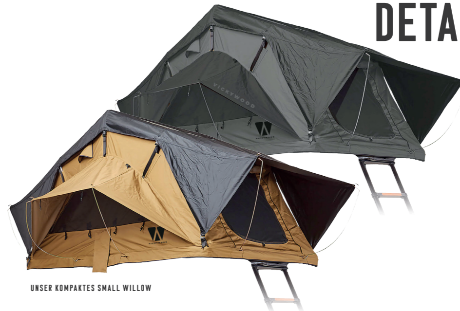
UNSER KOMPAKTES SMALL WILLOW

Innenmaße (L x B x H): 240 x 163 x 126 cm Gewicht: 64 kg Eingeklappt (L x B x H): 125 x 165 x 29 cm