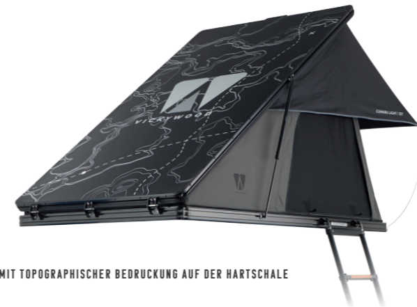
MIT TOPOGRAPHISCHER BEDRUCKUNG AUF DER HARTSCHALE

Innenmaße (L x B x H): 140 x 213 x 130 cm Gewicht: ca. 80 kg (ohne Leiter) Eingeklappt (L x B x H): 152 x 223 x 15 cm