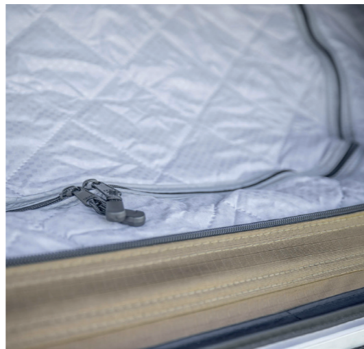
THERMO-INNENZELT ZUM EINHÄNGEN IM DACHZELT

Das Vorzelt für das BIG WILLOW ist eine vielseitige Ergänzung zu Deinem Dachzelt. Es passt nahezu für jedes Fahrzeug, da es über das smarte Zipp-System in der Höhe eingestellt werden kann ( 165 - 180 cm oder 200 - 220 cm ). Mit einem Vorzelt hast Du die Option, Dein Dachzelt um zusätzlichen Lagerplatz, weitere Schlafplätze oder einen kleinen geschützten Aufenthaltsbereich zu erweitern. Durch die überlappenden Stoffbahnen, die wasserdichten Reißverschlüsse und die getapten Nähte ist das Vorzelt wasserabweisend und in geschlossenem Zustand blickdicht. Das Vorzelt lässt sich zu allen vier Seiten öffnen. Dadurch kommst Du jederzeit an Dein Fahrzeug und kannst seitliche Heckklappensysteme oder Küchenauszüge bei Wind und Wetter nutzen. Die Öffnungen sind mit flexiblen, engmaschigen Moskitonetzen versehen. Somit bist Du beim Lüften Deines Vorrums vor unangenehmen kleinen Fluggästen sicher. Über ein Teleskopstangen-System hast Du die Möglichkeit, Dir eine kleine überdachte Veranda zu schaffen, die Dir Schatten spendet oder einen Sitzplatz im Trockenen