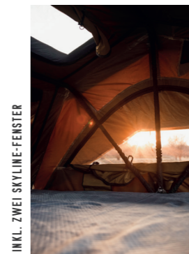
INKL. ZWEI SKYLINE-FENSTER