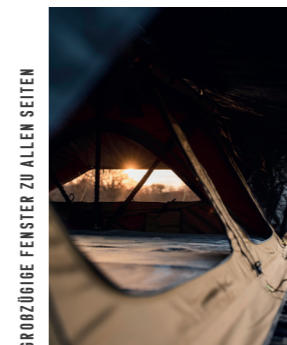
GRÖßTIGE FENSTER ZU ALLEN SEITEN