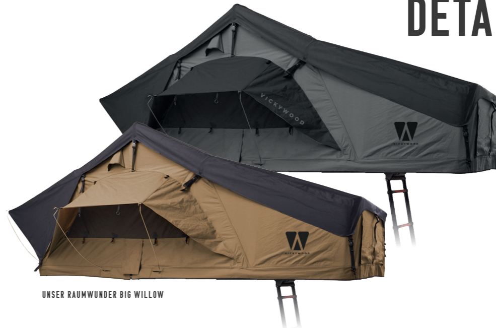
UNSER RAUMWUNDER BIG WILLOW

Innenmaße (L x B x H): 240 x 220 x 126 cm Gewicht: 100 kg Eingeklappt (L x B x H): 125 x 223 x 29 cm